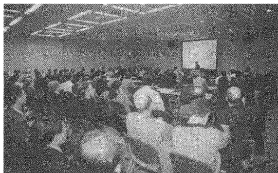
写真2 口頭セッション風景