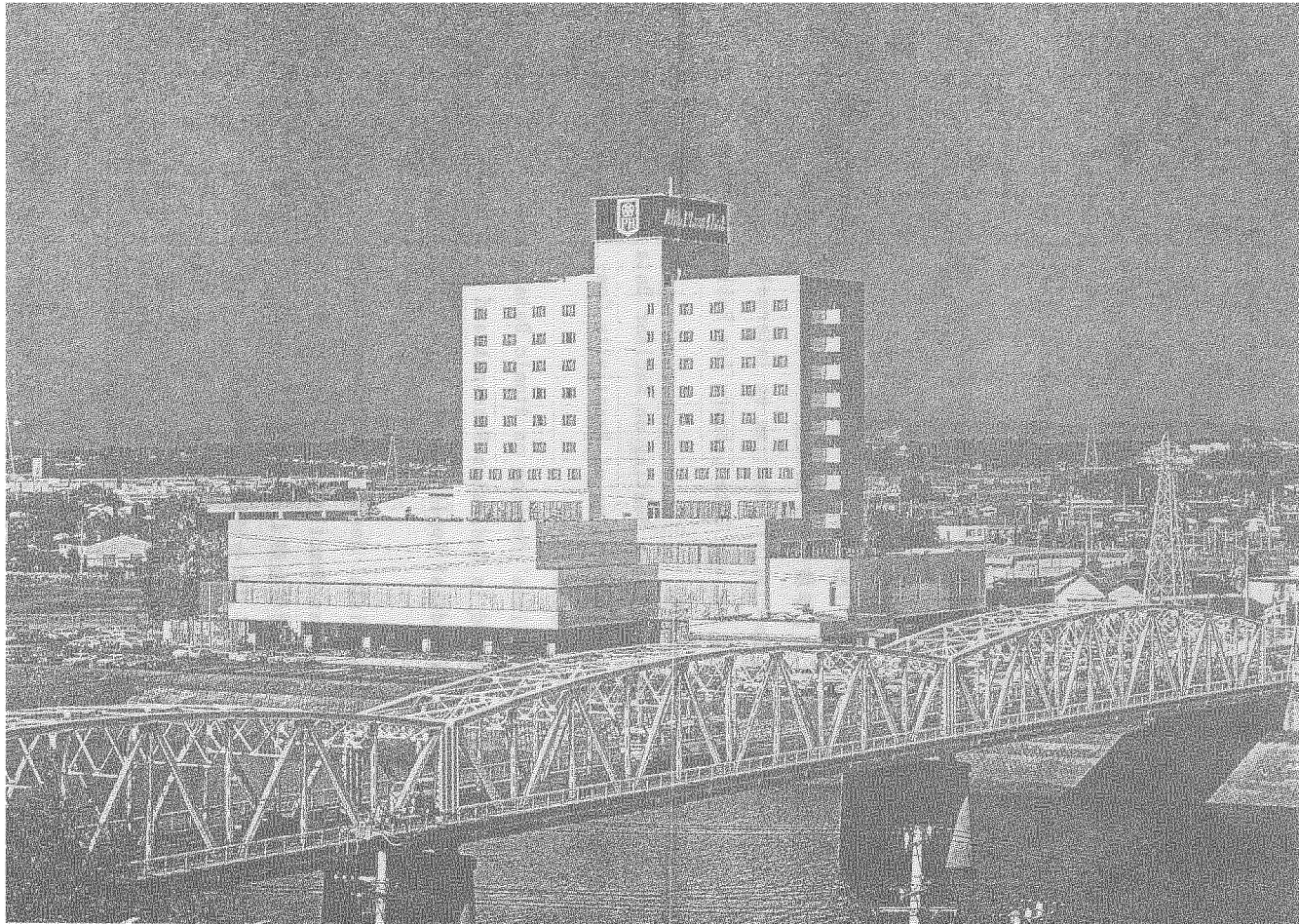
核データ国際会議の会場となる水戸プラザホテル