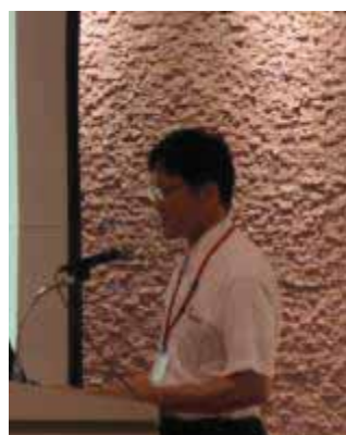
永谷氏(掛川市役所)