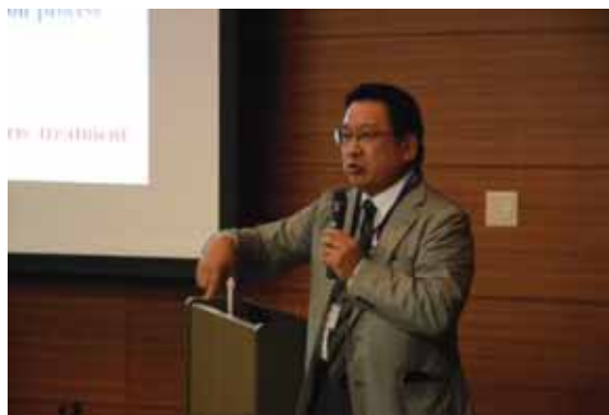
東北大学佐藤教授による招待講演

前セッションに引き続き、FBR 及び革新燃料・材料に関して招待講演 1 件及び口頭発表 4 件の発表がなされた。東北大学佐藤教授から “Pyrochemical Study of Uranium and Zirconium Oxides for Fuel Debris Treatment” として、東北大多元研における燃料デブリの取り扱いの基礎検討についての研究が招待講演として報告された。フッ化物、塩化物、硫化物を用いた高温化学プロセスの有効性について述べられ、特に硫化プロセスに焦点を当てた研究報告がなされた。JAEA の田中氏から “Thermophysical