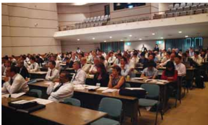
プレナリーセッションの様子

GNF-A の R. Stachowski 氏は、「米国における BWR 燃料の見通し」と題して、これまでの 50 年間の BWR 燃料集合体の設計改良の経緯と信頼性向上の実績を紹介した上で、今後の開発の方向性として、チャンネル曲りの抑制などによる信頼性向上、燃料サイクルコストの低減な