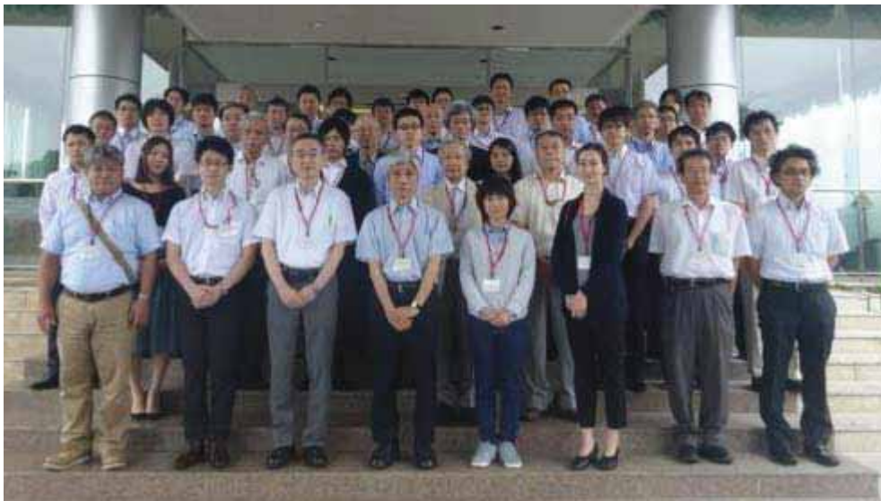
セミナー参加の皆様 (セミナー会場 つま恋ロビー前にて)

7月10日及び11日には燃料及び燃料挙動に関する基礎や学会賞・部会賞受賞記念講演の他、原子力発電所における燃料取扱い、燃料挙動解析技術開発の現状、炉心燃料分科会の活動、等、核燃料分野にて現在までに実施されてきた内容から今後着目すべき内容にわたって様々な分野の講師の方に講演いただくとともに活発な議論が行われた。続く12日には中部電力浜岡原子力発電所の見学会が実施され、現在整備が進められている安全性向上に関わる重要な設備等を見学しつつ質疑応答を行った。