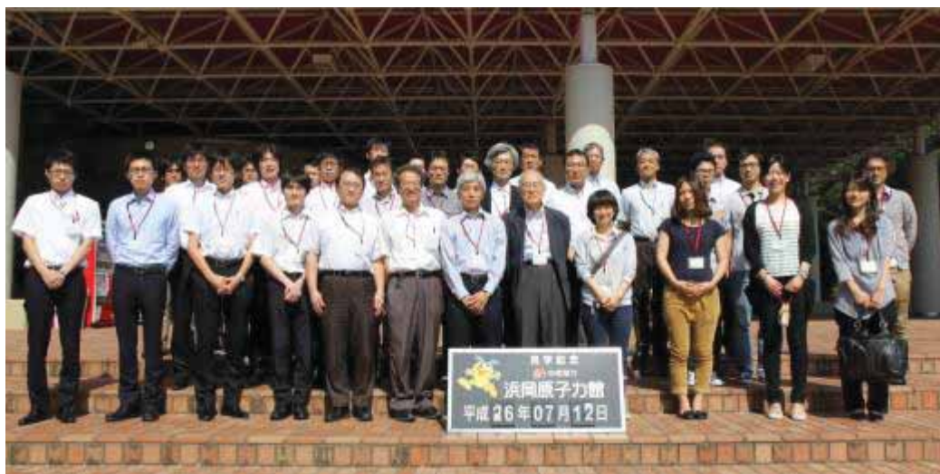
見学会に参加いただいた皆様 (中部電力株式会社浜岡原子力館前にて)

制基準への対応に向けた取り組みについて、中部電力の方から説明いただいた。その後 2 班に分かれ、バス、徒歩にて発電所内外を見学した。原子力館では、防波壁や原子炉施設の模型等を利用して、原子力施設の安全対策について分かりやすく説明いただいた。原子力発電所の敷地内では、建設が進む防波壁、取水槽、海水ポンプ、原子炉建屋の大物搬出入口扉、フィルターベント設置場所、5号機のギャラリー(オペフロ及び中央制御室)、ガスタービン発電機、緊急時対策所、等の施設及び設備を見学した。また、浜岡原子力発電所には、過去に経験した事故やトラブルから学んだ教訓及びノウハウを風化させることなく次の世代に伝承していくための“失敗に学ぶ回廊”とよばれる部屋があり、過去の事故及びトラブルの概要を示すパネル、実際にトラブルの原因となった部品等の実物または模型が展示されている。原子力工学に携わる者の興味を引く内容ばかりであったが、見学時間が押ししてしまったために、残念ながら十分に見回ることができなかった。見学会の最後には質疑応答の時間が設けられ、活発な議論が行われた。全体の見学時間として 2 時間半程度を予定していたが、この時間内では収まらないほどの盛り沢山の内容であった。