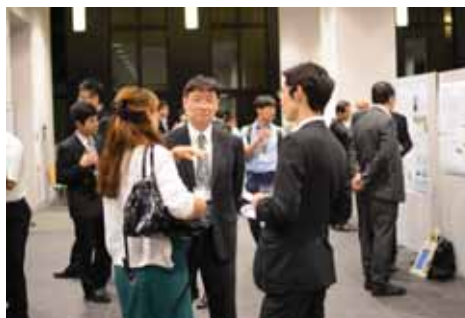
ポスターセッションの様子

台湾では導入されていない燃料外観検査へのファイバースコープ適用に関して耐放射線性等の議論が交わされた。JAEA 柴田氏から” Chemical interaction between granular B 4 C and 304L type stainless steel materials used in BWR of Japan”として日本のBWR実機で採用されている制御棒材料である顆粒状 B 4 C と SUS304L との化学的相互作用に関する報告がなされ、見かけの反応速度、及び制御棒の熔融進展挙動等の基礎的知見が得られている。