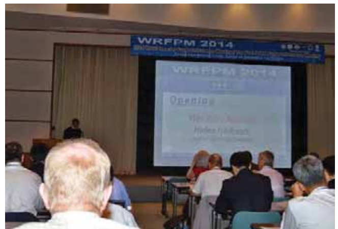
オープニングの様子