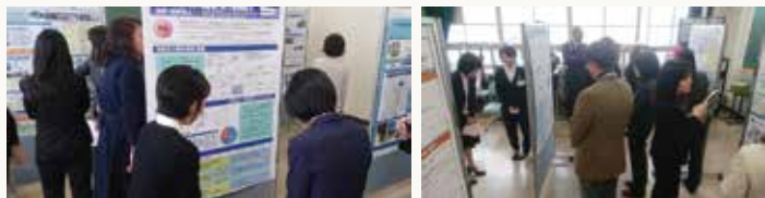
2019年 春の年会 ポスターセッションの様子

2020年秋の大会では、「私の働き方」をテーマとしたオンラインでのポスターセッション、また、日頃感じている課題やその解決策などについての意見交換会を開催しました。