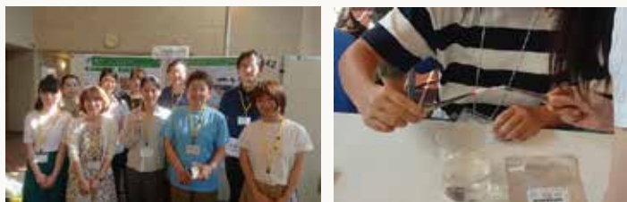
「女子中高生夏の学校2019 ～科学・技術・人との出会い～」への出展の様子

2019年度は量子科学技術研究開発機構 (QST) 高崎量子応用研究所と協力して、実験を行いました。